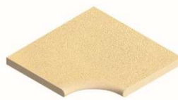
Element Innenwinkel R15