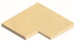
Element Ecke 90°