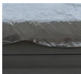
Winterabdeckung Winter cover CIKPCOR28