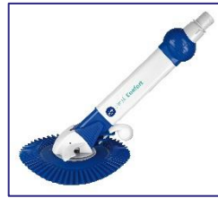
Automatischer Reiniger Automatic cleaner AR20682