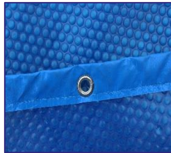
Isothermabdeckplane Isothermic cover CV7900892