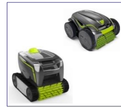
Roboter Robot GT3220/GV3420